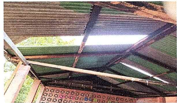
Foto 4: En esta fotografia se aprecia que algunas láminas ya no estan por el aire.