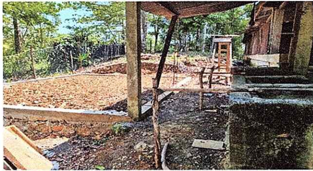
Foto1: aca se ve el mal estado del terreno.