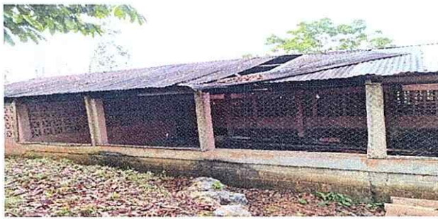
Foto 3: En esta fotografia se aprecia que el deterioro del techo esta mas que evidente.