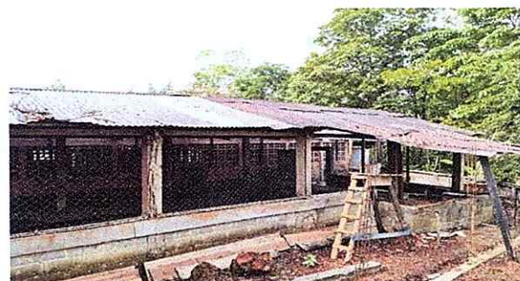
Foto 6: Desde otra perspectiva se ve el completo deterioro de las laminas del salon.

Observación: Si es necesario se pueden agregar hojas adicionales y actualizar el número de hojas.